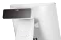
Display Cliente • VFD (2 Linee x 20 Caratteri)