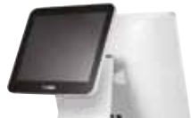
Secondo Display • 9.7", 15" LCD